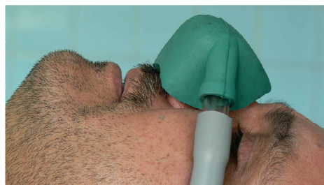
نگاره ی ۲: ماسک مخصوص بینی بر روی صورت بیمار

پس از دو دقیقه، تجویز نیتروس اکسید ۱۰ درصد آغاز شد و هر یک دقیقه، نیتروس اکسید ۱۰ درصد، با ثابت ماندن میزان جریان گاز در دقیقه، افزوده شد تا به ترکیب گازی ۵۰ درصد اکسیژن و ۵۰ درصد نیتروس اکسید برسد. دو دقیقه پس از آن، تزریق بی حس کننده ی موضعی به صورت بلوک عصب با استفاده از کارپول لیدوکایین دو درصد و اپی نفرین ۱/۸۰.۰۰۰ انجام شد. پس از اطمینان از اثر بی حس کننده ی موضعی، کار دندانپزشکی آغاز شد. کار دندانپزشکی در همه ی بیماران، شامل یک ترمیم دو یا سه سطحی آمالگام در یک سمت فک پایین بود. شدت واکنش تهوع به هنگام کار، برپایه ی جدول ۱، اندازه گیری شد. همچنین، شرایط انجام کار برپایه ی جدول ۲ براساس روش DSTG ۱ ثبت شد. از این روش برای اندازه گیری شرایط انجام کار در بیماران تحت آرام بخشی استفاده شده است، ولی در این بررسی چگونگی اثر واکنش تهوع بر کار دندانپزشکی با این دستگاه، اندازه گیری شده است (۲۱) و نتایج ثبت شده و با استفاده از آزمون آمار توصیفی، آزمون اسپیرمن، آزمون من ویتنی و آزمون