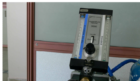
نگاره ی ۱: دستگاه تجویز ترکیب گازی آرام بخشی استنشاقی

از ۱۴ بیمار مورد بررسی، چهار نفر مرد (۲۸/۶ درصد) و ۱۰ نفر زن (۷۱/۴ درصد) بودند. پایین ترین سن بیماران ۱۹ و بیشترین آن ۴۹ سال و میانگین سنی آنان، 29/21 \pm 8/8 سال بود. به هنگام کار دندانپزشکی، تحت آرام بخشی استنشاقی برای بیماران دارای واکنش تهوع قوی به هنگام کار، در ۱۱ بیمار این واکنش کاملا غیر فعال شده و یا کمی فعال بوده و در سه نفر (۲۱/۴ درصد) این واکنش به هنگام کار همچنان فعال برجا ماند (جدول ۳ و نمودار ۱). در نه نفر (۶۴/۲ درصد) از بیماران، شرایط کار دندانپزشکی درجه یک و دو بود و کار دندانپزشکی به آسانی قابل انجام بود و در سه نفر (۲۱/۴ درصد) از