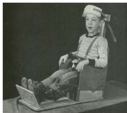
شکل ۴: صندلی Plywood از ابتدایی ترین وسیله، برای نگهداری کودک به شمار می آید.

یکی از وسایلی، که می تواند به گونه ای مؤثر حرکات ناخواسته ی دست و پا و بدن بیمار را مهار کرده و حرکات ناشی از ناهنجاری های عصبی بیمار و نیز، حرکات غیر ارادی او را به خوبی تعدیل سازد، Pedi-wrap است. این وسیله، با ساختمان مشبک نایلونی ای که دارد، از بالا رفتن دمای بدن بیمار جلوگیری کرده و اندام های بدن او را به گونه ای دلخواه، پشتیبانی و نگهداری می کند. این شبکه ی نایلونی به دور بیمار بسته شده و او را بی حرکت بر روی صندلی دندانپزشکی نگه می دارد. تسمه های ویژه شامل تسمه های