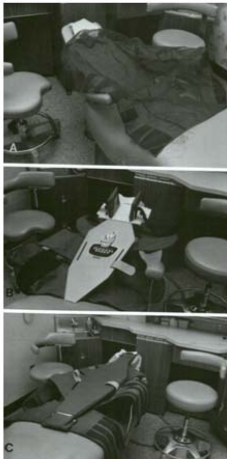
شکل ۷: Papoose board یا شکل و طرح جناب خود، کودک او را به نشستن بر روی صندلی دندانپزشکی تشویق کرده و حرکات او را مهار می‌کند.

استفاده از وسایل محدود کننده‌ی درون دهانی (intraoral restraints) برای جلوگیری از احتمال آسیب به بافت‌های ظریف و نرم دهان کودک و نیز، ادامه و تکمیل کار درمان دندانپزشکی کودکان ناتوان، در بسیاری از موارد می‌تواند موثر باشد. این وسایل، در نگهداری و ثابت کردن فک‌های کودک در موقعیت مناسب موثر بوده و از خستگی و ناراحتی وی نیز، در مدت درمان دندانپزشکی جلوگیری می‌کند.