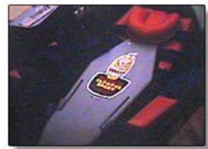
شکل ۱: مراحل استفاده از Papoose board برای مهار جسمانی کودک در انجام روش‌های پرتونگاری