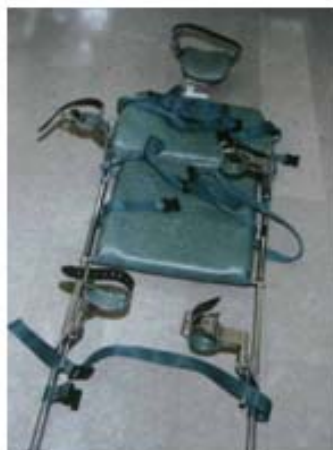
شکل ۱۲: دستگاه محدودکننده‌ی جسمانی شامل بخش‌های گوناگون مهارکننده‌ی سر، بدن، دست‌ها و پاهای بیمار

استفاده از وسایل محدودکننده‌ی بدنی، در واقع ابزاری کمک کننده برای بیماری است، که مهار ماهیچه‌های خود را نداشته و یا دارای حرکات ناخواسته‌ی، است که شاید به دلیل وجود عقب