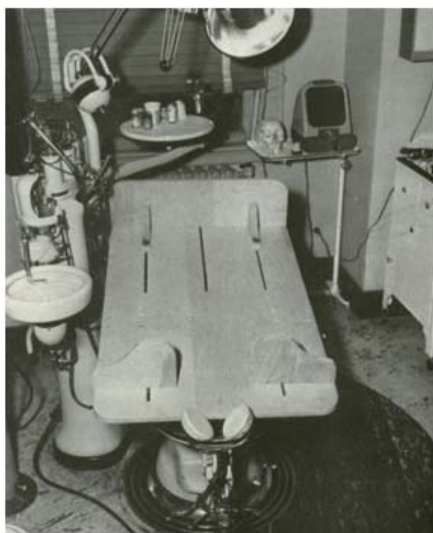
شکل ۵: میز عمل Plywood (Operating table) برای نگهداری کودک برای اعمال جراحی در دندانپزشکی

صندلی Plywood از ابتدایی ترین صندلی هایی بود، که از جنس چوب به وسیله ی مانوئل آلوم در سال ۱۹۵۰ ساخته شده و بر روی صندلی دندانپزشکی قرار می گرفت. شکل دیگر این وسیله به صورت میز عمل (Operating table)، بیمار را برای انجام درمان های دندانپزشکی، به ویژه در حالت طاق باز به خوبی مهار می کرد و می توانست مقداری به سمت عقب شیب داده شده تا از حرکت کودک به سوی جلو جلوگیری کند. این وسیله، دارای یک سر بند (Headgear) پلاستیکی نیز، برای مهار حرکات سر بیمار بود (۲۶ و ۲۷) (شکل ۴ و ۵).