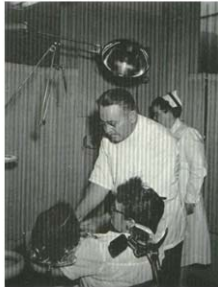
شکل ۹: یونیت دندانپزشکی آلایوم دارای قسمت نگه دارنده‌ی سرکودک