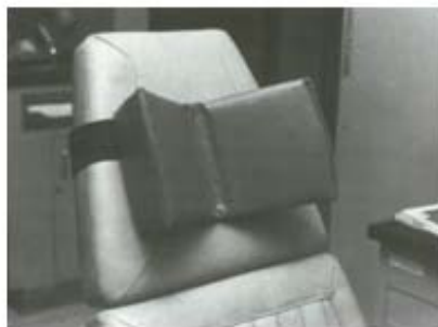
شکل ۸: Cerebral palsy head support برای محدود کردن حرکات سر بیمار