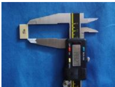
نگاره‌ی 1: اندازه‌گیری ابعاد نمونه

L_2 - L_0 = میزان تغییرات ابعادی پس از هفت روز