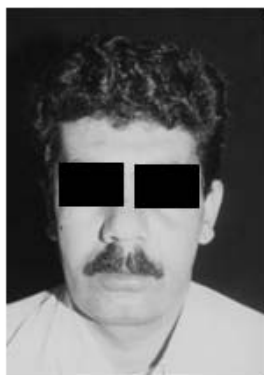
شکل ۲: صورت بیمار پس از عمل

در نمای پرتونگاری، یک آسیب بزرگ با تخریب استخوان بدون حاشیه مشخص مشاهده شد. سینوس فک بالا کاملاً به وسیله ی تومور پر شده بود. در نمای جلویی پشتی کاسه ی سر (PA of Skull) و واترز