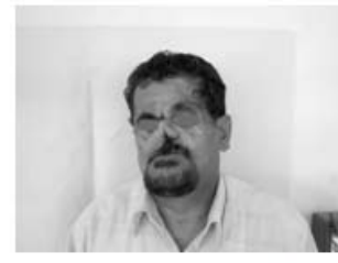
شکل ۳: بازسازی صورت بیمار با پیوند پایه دار پوست و ملامیچه