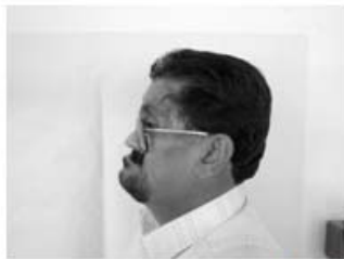
شکل ۵: بازسازی صورت بیمار به وسیله ی پروتز بینی و لب بالا