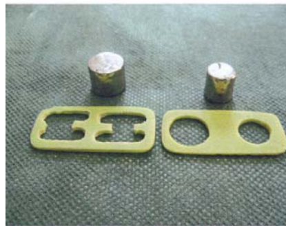
نگاره‌ی ۳: فضا نگهدارنده و تخلیه‌کننده‌ها

برای دادن واش دوم به قالب، تخلیه‌کننده که هدف از استفاده از آن در این روش، ایجاد فضا برای بیرون راندن اضافه‌های ماده‌ی قالبگیری واش به هنگام ریلاین واش (واش دوم) بود، از روی دای‌ها برداشته شد و ماده‌ی واش آماده گردید و واش، دوباره در قالب ریخته شد و قالبگیری انجام گرفت (نگاره‌ی ۳). مراحل قالب‌ریزی همانند روش قبل انجام گرفت و نمونه‌های گچی فراهم گردید.