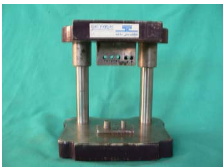
نگاره‌ی ۱: الگوی آزمایشگاهی

حجم نمونه با استفاده از فرمول برآورد حجم نمونه و با توجه به بررسی‌های انجام شده، برای هر روش، ۱۵ عدد و روی هم رفته ۶۰ عدد در نظر گرفته شد.