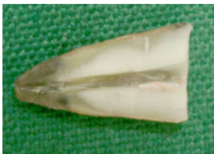
ب: اندازه ی نفوذ رنگ در نمونه ی پر شده با سیلر AH 26