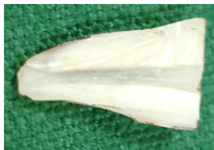
نگاره ی یک: اندازه ی نفوذ رنگ در نمونه ی شاهد منفی