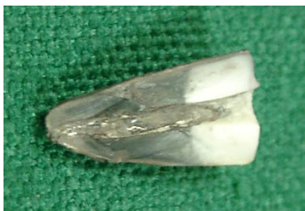
نگاره ی دو: اندازه ی نفوذ رنگ در نمونه ی شاهد مثبت