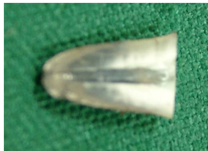
الف: اندازه ی نفوذ رنگ در نمونه ی پر شده با آپاتیت روت سیلر

نگاره ی ۳: اندازه ی نفوذ رنگ در گروه های آزمایشی