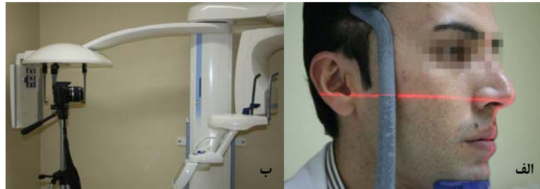
نگاره‌ی ۱ الف ثابت شدن سفالوستات سر در این محل ب دوربین دیجیتال روی سه پایه‌ای که جای قرارگیری پایه‌های آن روی زمین نشانه‌گذاری شده است.