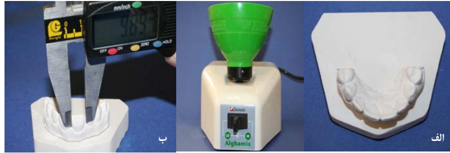
نگاره‌ی ۲ الف دستگاه آلگامیکس و قالب ریخته شده با دستگاه مزبور ب اندازه‌گیری با دقت ۰/۱ میلی متر با کولیس بر روی کست

گردید. در این بررسی p < 0.05 به عنوان معنادار در نظر گرفته شد و برای بررسی همبستگی خطی میان اعداد از آزمون آماری ضریب همبستگی پیرسون و برای بررسی اختلاف میان اعداد به دست آمده از کست و عکسبرداری از آزمون تی استفاده گردید.