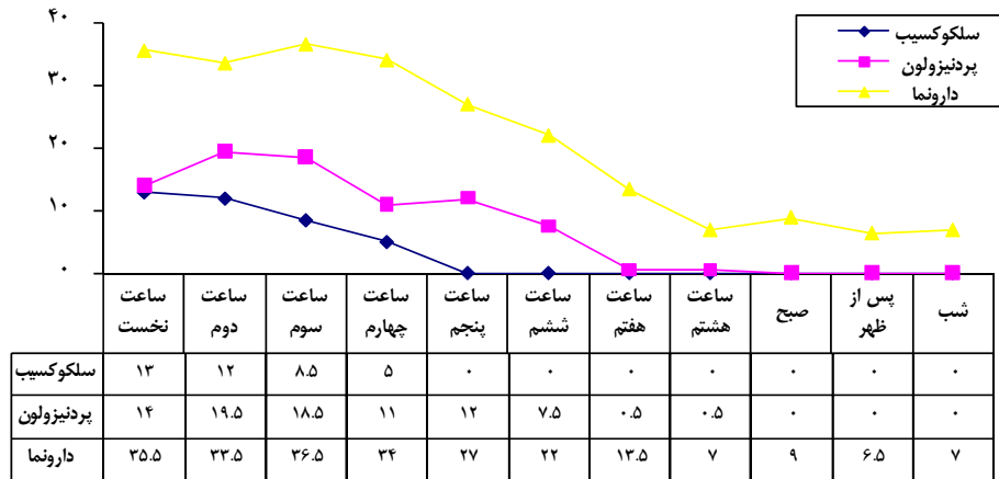
نمودار ۱ میان‌هی نمره‌ی درد در مقیاس VAS در سه گروه سلکوکسیب، پرورنیزولون و پلاسبو در هر دوره‌ی زمانی

نخست پس از جراحی در سه دفعه‌ی زمانی (سه، پنج و شش) نسبت به پرورنیزولون در مهار درد بیماران موثرتر بوده است و گرچه در هشت دفعه‌ی زمانی برجا مانده‌ی دیگر تفاوت معنادار آماری در شدت درد گزارش شده توسط بیماران میان دو دارو دیده نشد ولی نمره‌ی درد در همه‌ی دفعه‌ها با مصرف داروی سلکوکسیب کمتر از پرورنیزولون به دست آمد (جدول ۱).