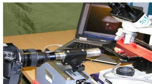
نگاره‌ی ۱ تنظیم دوربین از درون لنز کاتتومتر جهت فیلم برداری از لحظه‌ی چکاندن تا پخش شدن کامل قطره بر روی سطح عاج